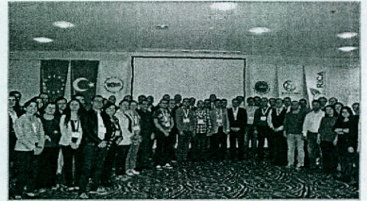
İşletme Anketi Eğitimi, Nisan 2015, Ankara