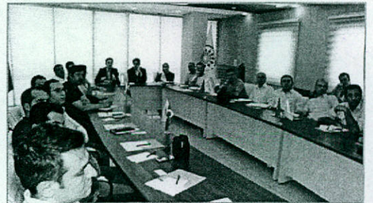
Ipekyolu Kalkınma Ajansı, Haziran 2015, Gaziantep