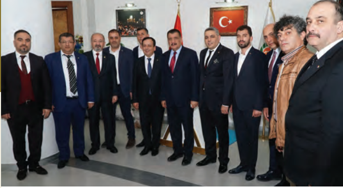
Malatya Büyükşehir Belediye Başkanı Selahattin Gürkan