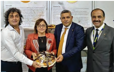
Gaziantep Büyükşehir Belediye Başkanı Fatma Şahin