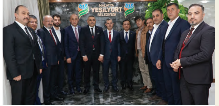
Yeşilyurt Belediye Başkanı Mehmet Çınar