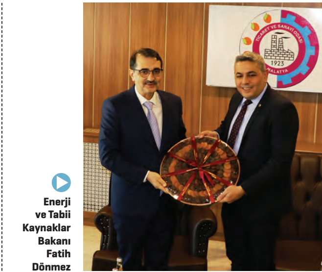
▶ Enerji ve Tabii Kaynaklar Bakanı Fatih Dönmez