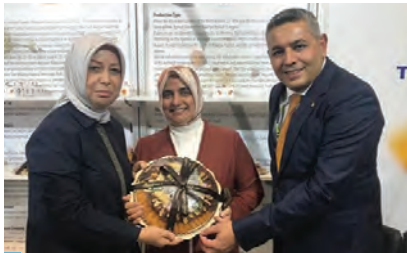
AK Parti MKYK Üyesi ve AK Parti Malatya Milletvekilimiz Öznur Çalık