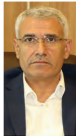
Battalgazi Belediye Başkanı Osman Güder

Tüm gayretler Malatyamız, ülkemiz için. TSO, Malatya için önemli. Malatyamıza bir şeyler kazandırma adına ciddi uğraş veriyor. Kendilerini kutluyor ve teşekkürlerimizi sunuyoruz. Sayın Sadıkoğlu'nun, Ankara'da, Türkiye Odalar ve Borsalar Birliği (TOBB) yönetim kurulunda olması, Malatyamız için ayrı bir avantaj. TOBB Başkanımız Rifat [Hisarcıklıoğlu] Bey'i de Malatya'ya davet ederek Malatyamız ile alakalı bilgilendirmede bulunuyoruz. Hatta Malatyamıza sık sık ziyaretlerinden dolayı fahri hemşerilik unvanı da verildi. Hepimizin ortak bir çabası var. O da halka, Hak'ka, Malatyalıya hizmet, Malatya'da ticareti daha çok canlandırmak, Malatya'daki insanların yaşam kalitesini yukarıya çıkarmak. Bu yönüyle akıbet hayr olur.