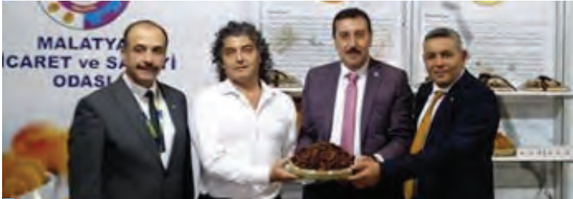
AK Parti MKYK Üyesi ve AK Parti Malatya Milletvekilimiz Bülent Tüfenkci