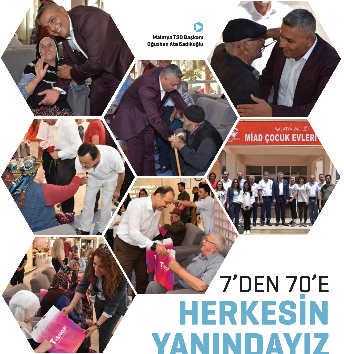
Malatya TSO Başkanı Oğuzhan Ata Sadıkoğlu