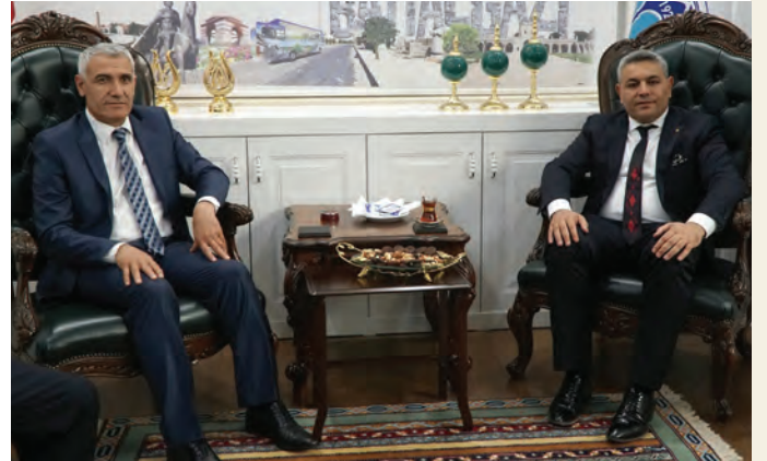
Battalgazi Belediye Başkanı Osman Güder

SADIKOĞLU: Başkanımız ciddi anlamda pozitif, yapıcı ve gerçekten diyaloga hazır. Bu işler ateşten gömlek. Ticaretin içinden gelmesi ve esnafın durumunu bilmesi bizler için avantaj. Başkanımız, Malatya ve